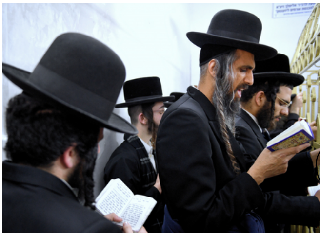
Modlący się chasydzi.

Przed II Wojną Światową ponad połowę ludności Góry Kalwarii stanowili Żydzi. Samo miasto nazywano jid. גער Ger od dynastii Żydów chasydzkich, którzy tutaj mieszkali. Miasto było polskim centrum chasydyzmu. Do cadyka (przywódcy religijnego) zjeżdżali się ludzie z całej Europy. Kultura i gospodarka kwitła, a judaizm był największą wspólnotą wyznaniową w mieście.